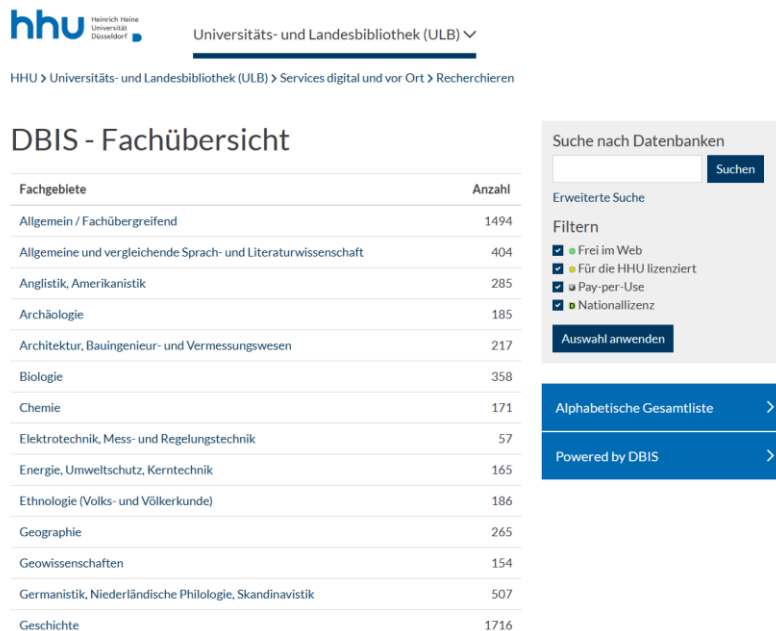
Abbildung 2: Screenshot zum Datenbank-Infosystem